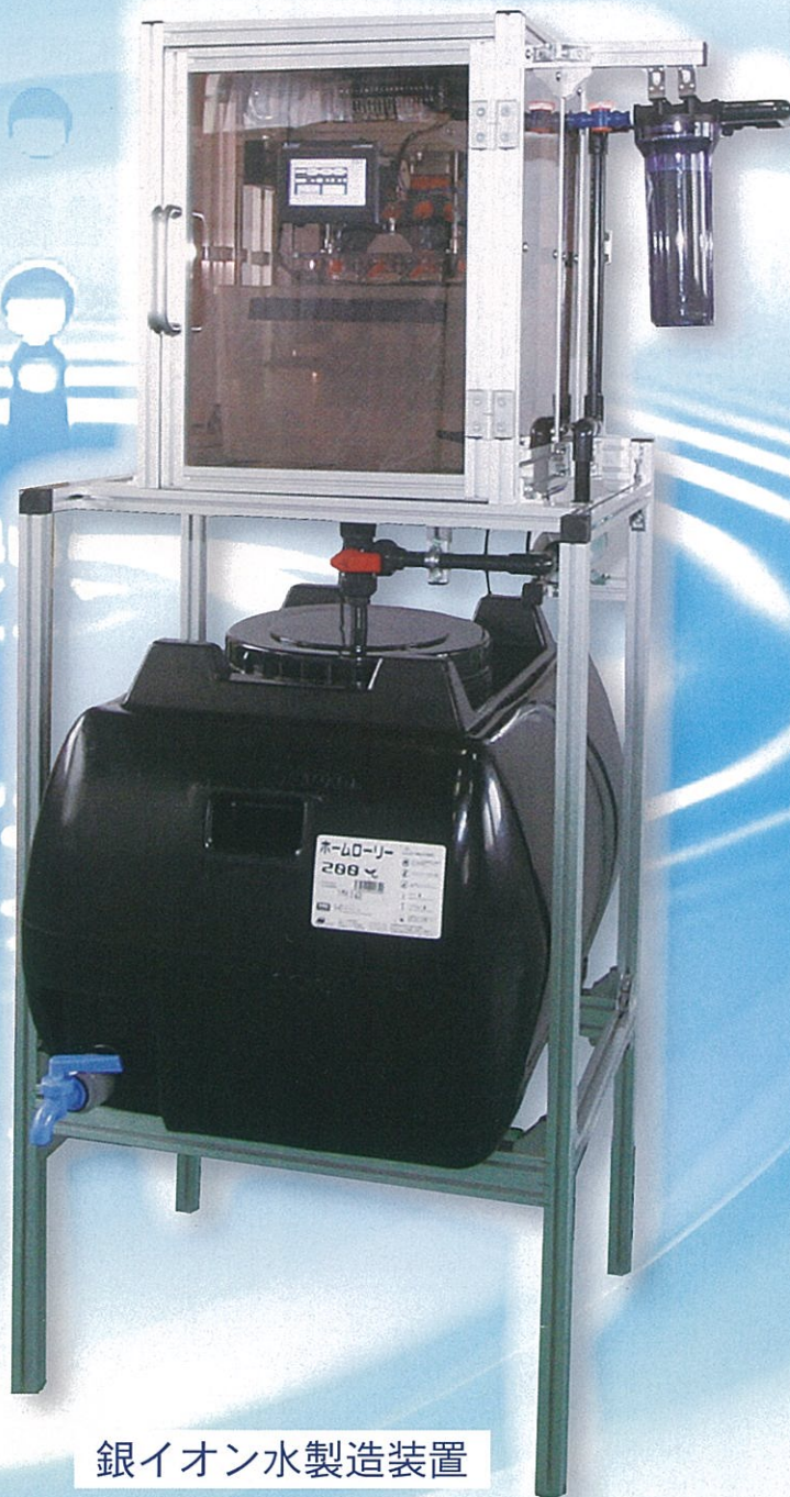
銀イオン水製造装置 (特許出願中)